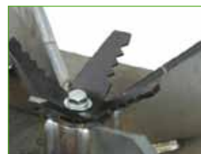
Waaier en voorsnijder