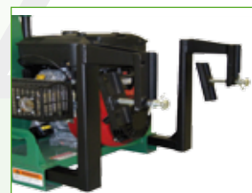
Set ophangbeugels voor montage

De aanzuigslang is van een hoogwaardige polyurethane kunststof vervaardigd. Met de belangrijke eigenschappen zoals: Licht in gewicht, glad aan de binnenzijde, doorzichtig, met stalen windingen versterkt. Waardoor deze gebruiksvriendelijk is en onder zware omstandigheden gebruikt kan worden.